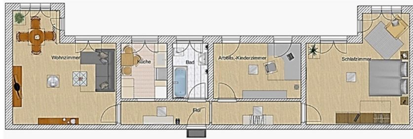
Grundriss mit Einrichtungsbeispiel