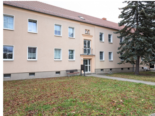
Außenansicht Eingang 2