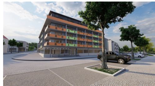
R2_26 - Foto