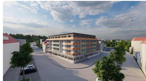
R2_30 - Foto