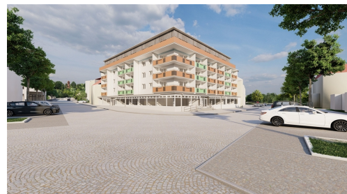
R2_25 - Foto