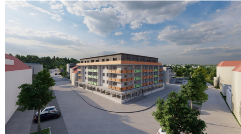
R2_30 - Foto

Unsere Wohnungen werden standardmäßig mit einem hochwertigen und modernen PVC-Belag, versehen. Die Wohnungen werden mit Raufasertapete weiß tapeziert und sämtliche Bäder sind gefliest. In diesem Wohnkomplex stehen mehrere Wohnungen in ähnlicher Art zur Verfügung. Gern richten wir diese Ihren Wünschen entsprechend her. Die reguläre Herrichtungszeit beträgt ca. 3 Monate. Weitere Wohnungsangebote erhalten Sie auf Anfrage.