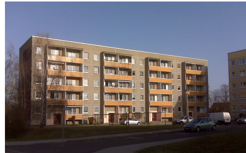
Kollerbergring 55-58 Außenansicht