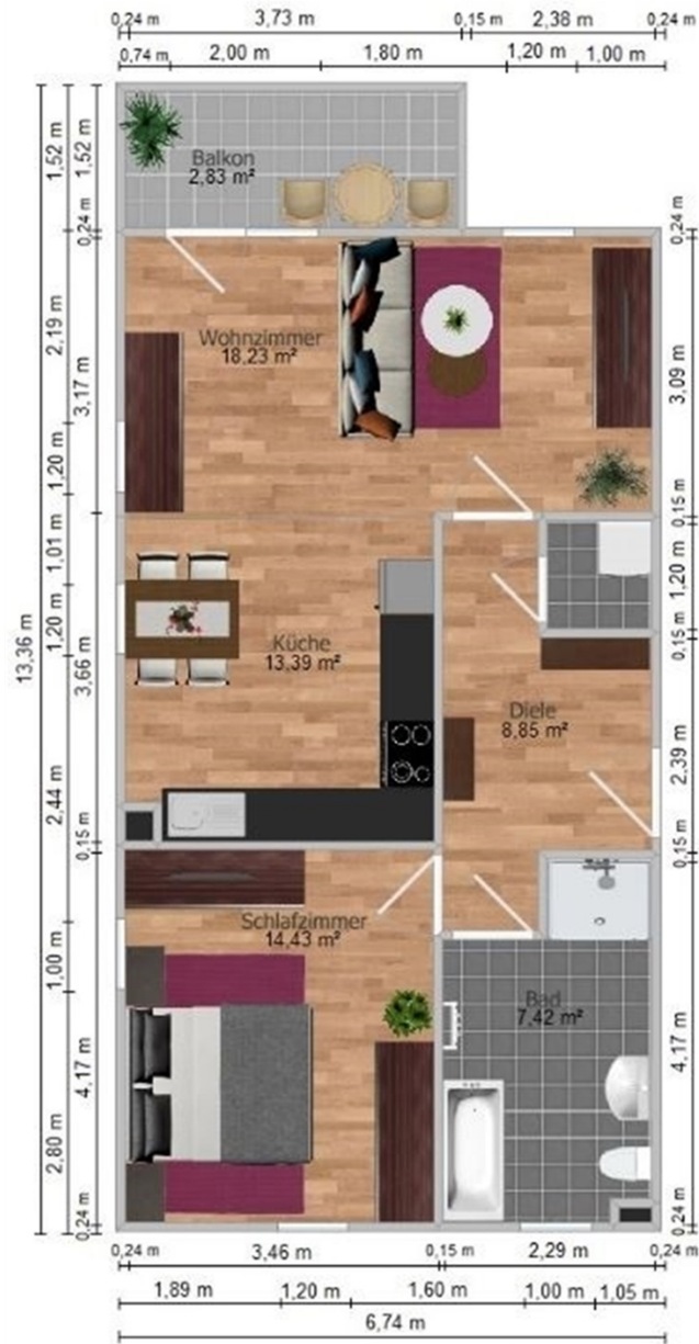
Gerberstraße 2, WE: 401 2-Raum-Wohnung, 65,15 m²